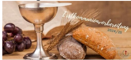
PFARREIENGEMEINSCHAFT BAD ESSEN - OSTERCAPPELN · SCHWAGSTORF

Nicht mehr lange und ein neuer Erstkommunionjahrgang startet! Der erste Elternabend für die Schwagstorfer Kommunionkinder findet am 30.09.2024 statt.