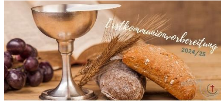
PFARREIENGEMEINSCHAFT BAD ESSEN - OSTERCAPPELN · SCHWAGSTORF

Nicht mehr lange und ein neuer Erstkommunionjahrgang startet! Der erste Elternabend für die Ostercappeler Kommunionkinder findet am 30.09.2024 statt.